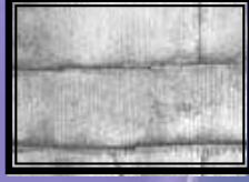
カラーベスト瓦のコケの発生